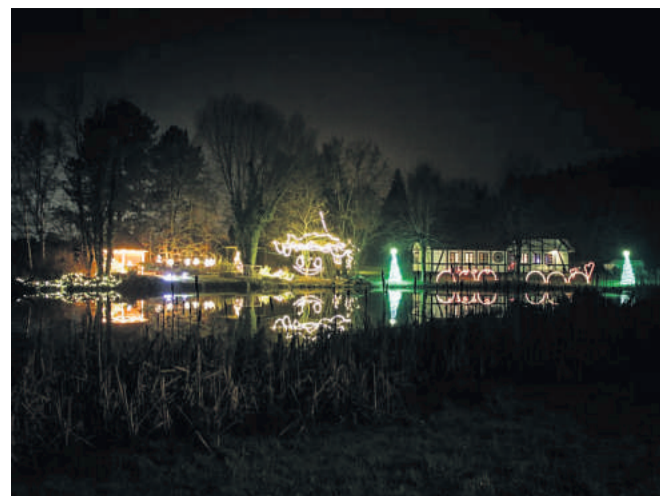
Sådan så julelysene ud sidste år.