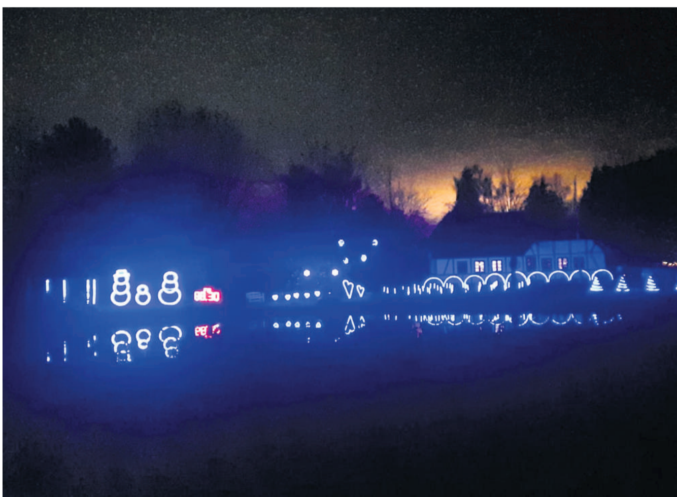
Elmelund Julelys som det tager sig ud i år.

- Som noget helt nyt i år kan man stemme på, hvilken sang man vil se/høre. Når man holder og ser lys, kan man på sin telefon gå ind på styrlyset.dk og stemme på en af sangene. Den sang med