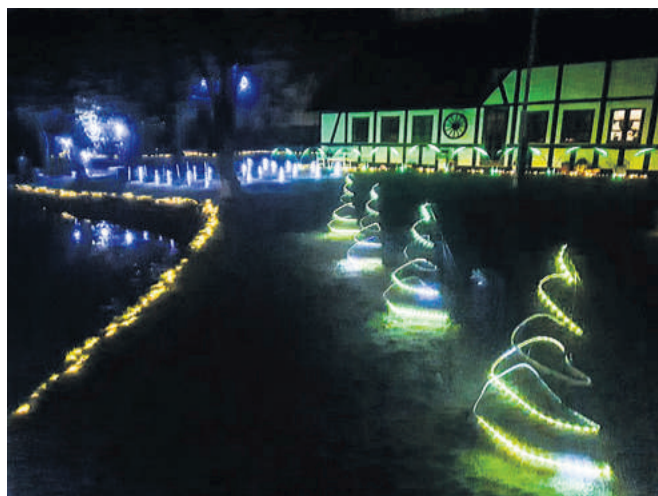
Lys der bliver til juletræer.